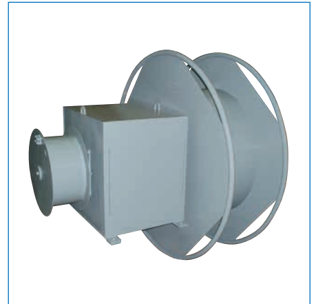
特殊リール/他力駆動式ケーブルリール