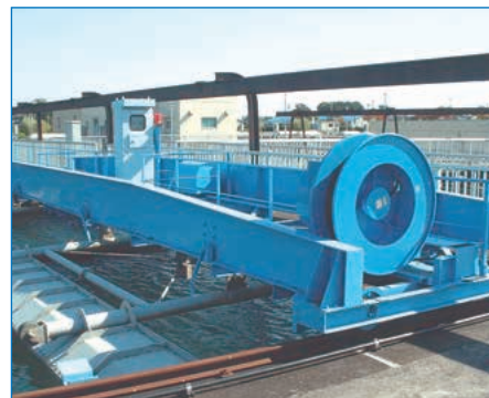
クラリファイヤ用CRP型ケーブルリール