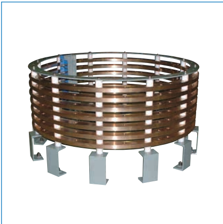
特殊スリッピング/大型スリッピング