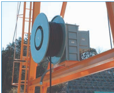
門型クレーン用CLU型ケーブルリール