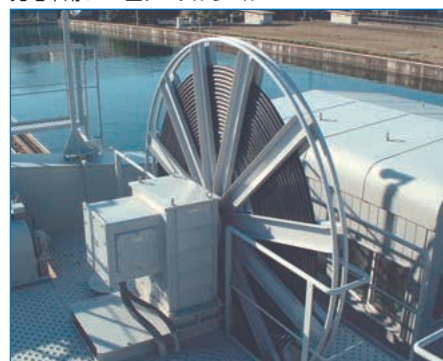
クラリファイヤ用CLU型ケーブルリール