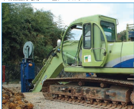
テレスコ用HRD型ホースリール