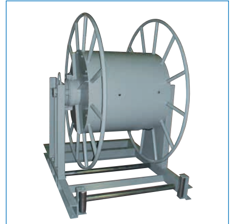
特殊リール/収納用リール