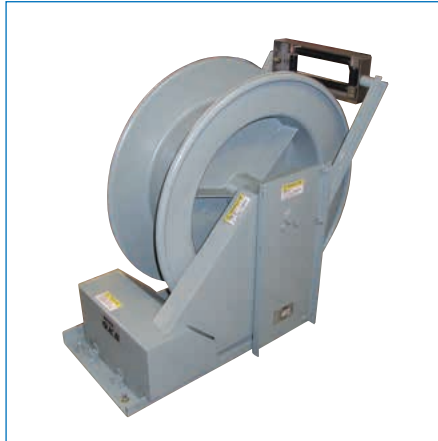
特殊リール/ギヤードモータ式ケーブルリール