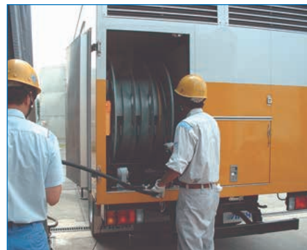
発電車用CMA型ケーブルリール