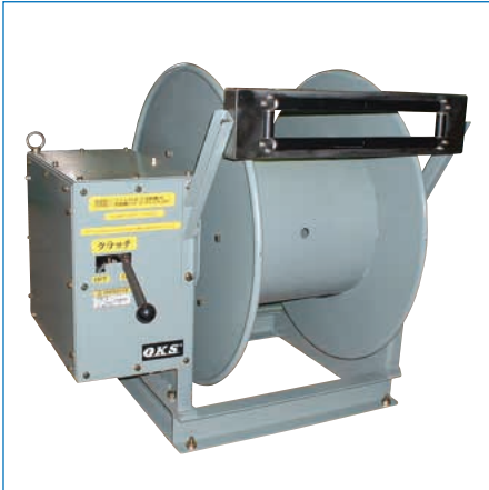
特殊リール/クラッチ機構付電動式ホースリール