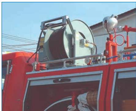
消防用HMA型ホースリール