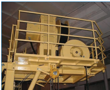
点検エレベーター用CLU・CRP型ケーブルリール