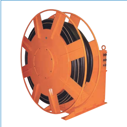
特殊リール/油圧駆動式ケーブルリール