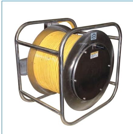
特殊リール/SUS製手動式ケーブルリール