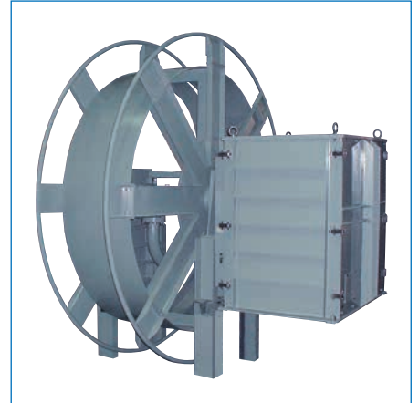
特殊リール/トルクコントロールユニット式ホースリール