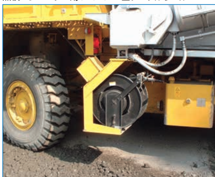
散水用HRW型ホースリール