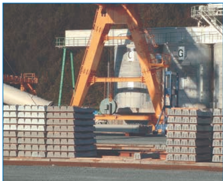
門型クレーン用CLU型ケーブルリール