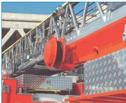
はしご車伸縮用CRE型ケーブルリール