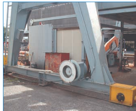
門型クレーン用CRP型ケーブルリール