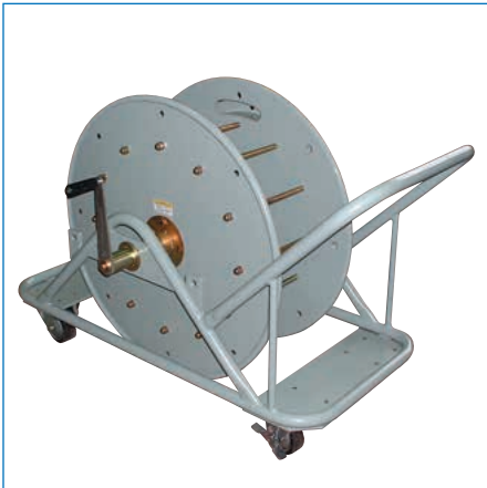
特殊リール/収納用リール