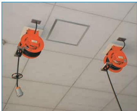
車載機器充電用CRD型ケーブルリール