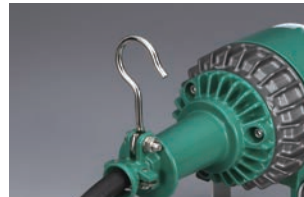
吊り下げフック付(真ちゅう製)

ハンドランプのように 移動して使用できます。 固定用ブラケットにて 仮固定設置も可能です。