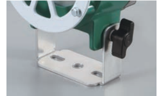
固定用ブラケットアーム付(アルミ製)