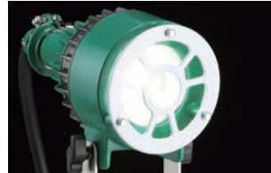
高出力チップ形LED(拡散シート付)