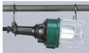
縦吊り・横吊りのできるWフック付