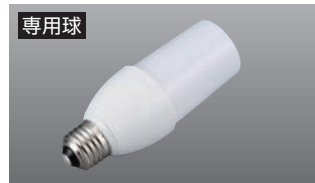
専用球 LDT10型10W LED電球 光の広がり/約300度