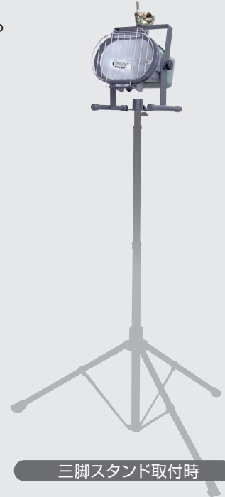
三脚スタンド取付時