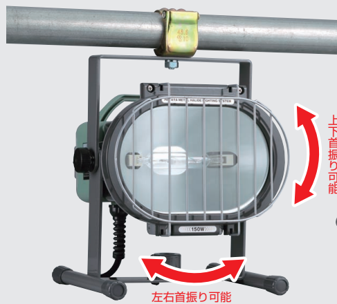
単管パイプ(φ48.6)取付時