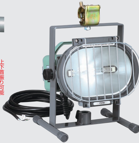
そのままでも床置きが可能