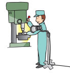
●工作機械の手元照明に…