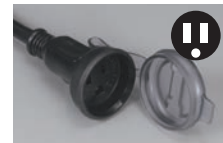
連結使用や補助電源として使用できる防雨型コンセント