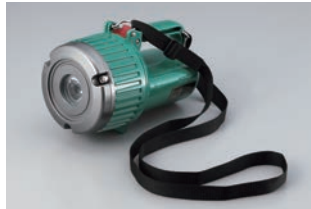
携帯に便利な肩掛けベルト付