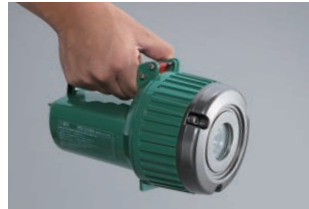
持ちやすいグリップ